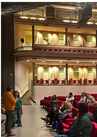
Fotografia del Col·loqui Post-Funció de 'Coralina la serventa amorosa'.